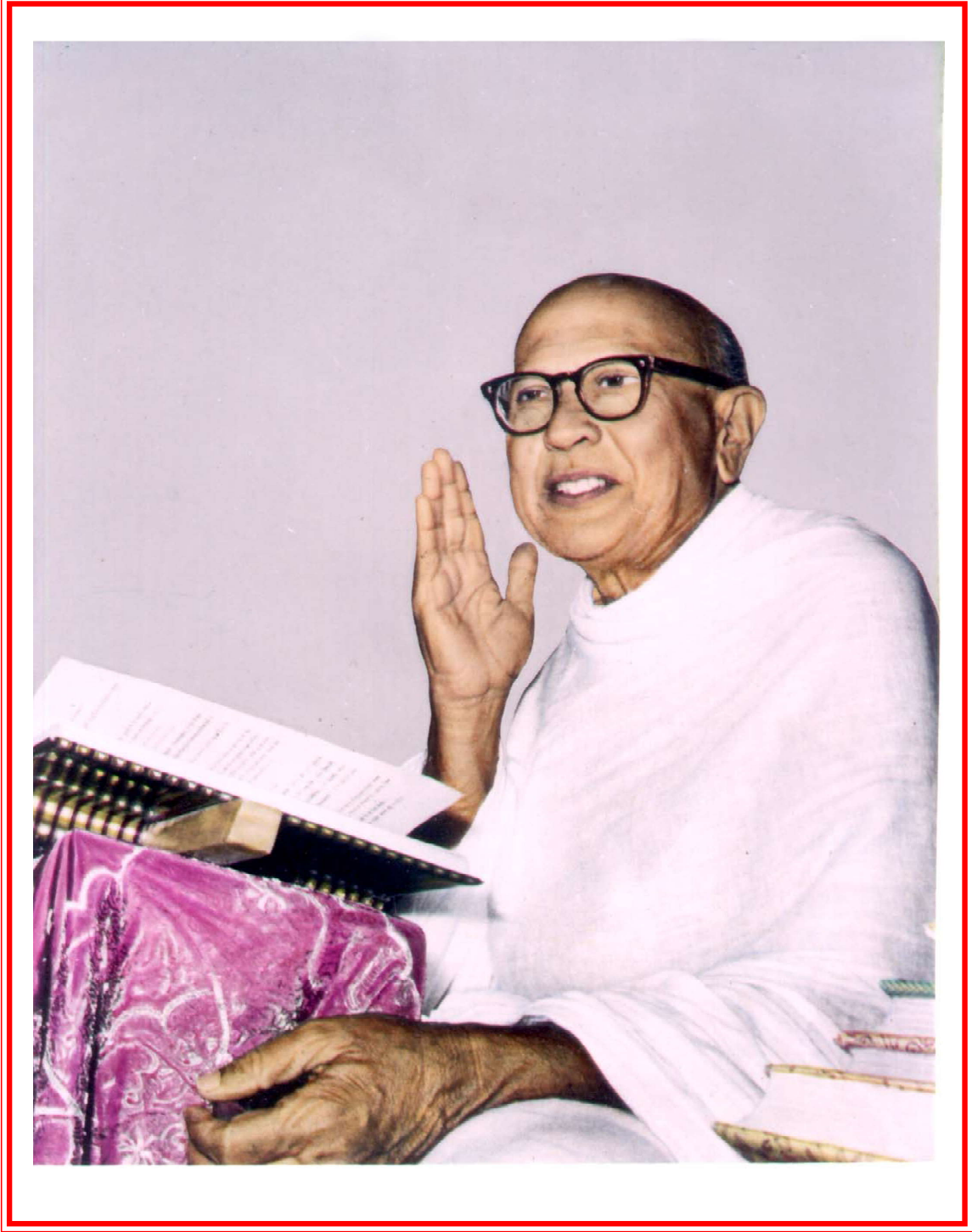
अध्यात्मयुगसर्जक पूज्य गुरुदेवश्री कानजस्वामी