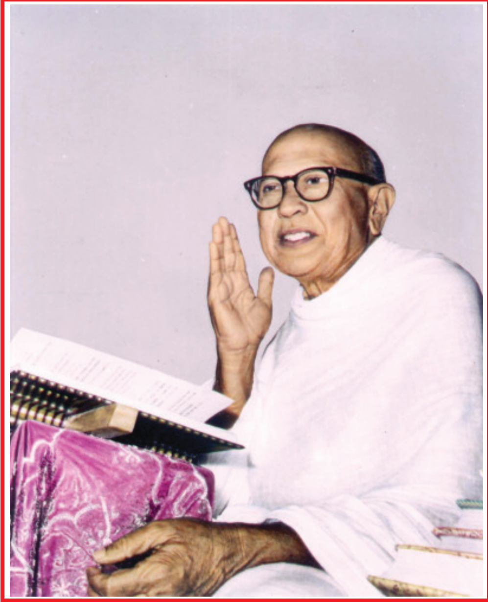
अध्यात्मयुगसर्जक पूज्य गुरुदेवश्री कानजीस्वामी