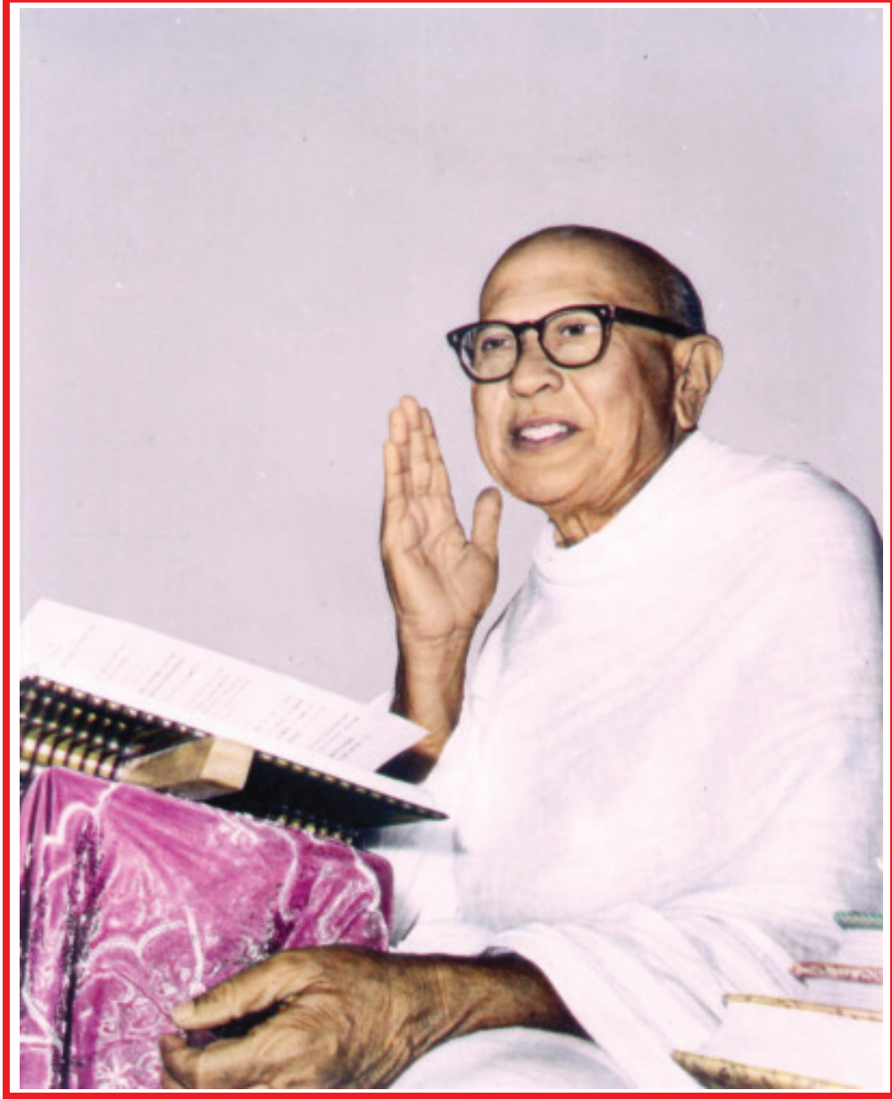
अध्यात्मयुगसर्जक पूज्य गुरुदेवश्री कानजीस्वामी