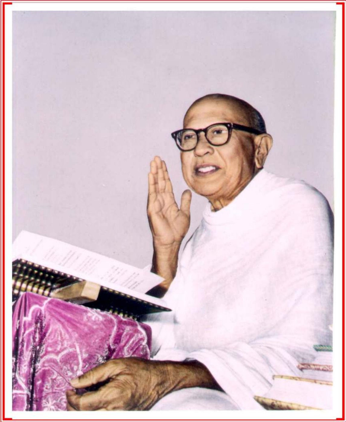
अध्यात्मयुगसर्जक पूज्य गुरुदेवश्री कानजीस्वामी