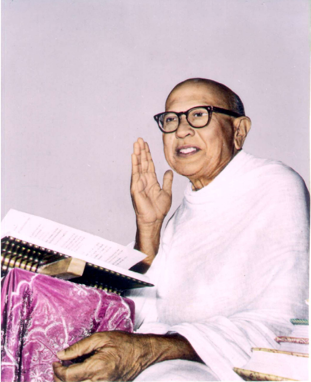
અધ્યાત્મયુગસર્જક પૂજ્ય ગુરુદેવશ્રી કાનજીસ્વામી