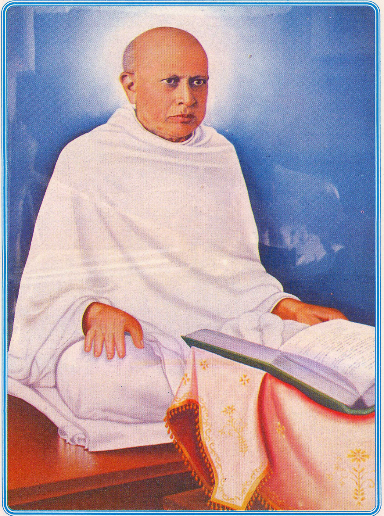
● परमोपकारी पूज्य गुरुदेव श्री कानशु स्वामी ●