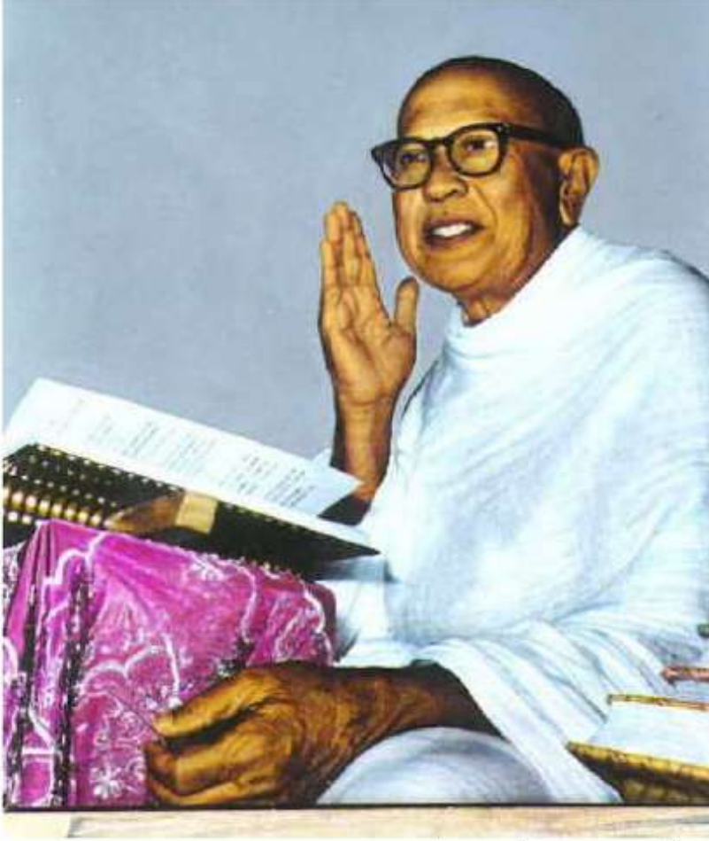
परम पूज्य आत्मज्ञसंत श्री कानजीस्वामी