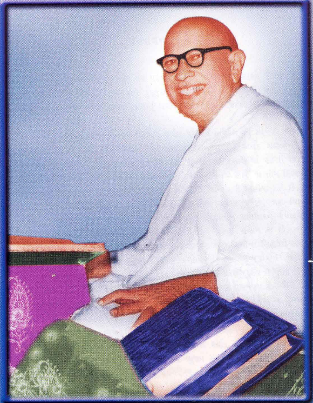
પરમોપકારી પૂજ્ય ગુરુદેવ શ્રી કાલજીસ્વામી