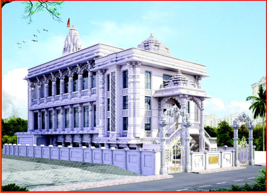
श्री सीमंधरस्वामी दिगंबर जिनमंदिर (विले पार्ला) मुंबई