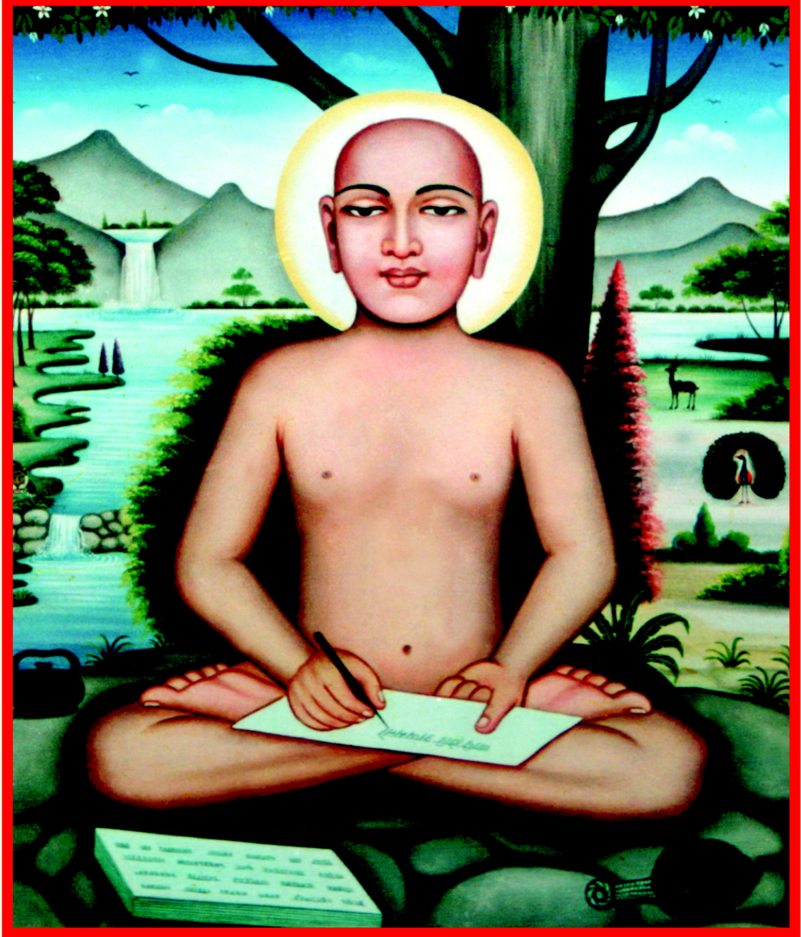
ભરતક્ષેત્રના મહાસમર્થ આચાર્ય ભગવાન શ્રી કુંદકુંદાચાર્યદેવ