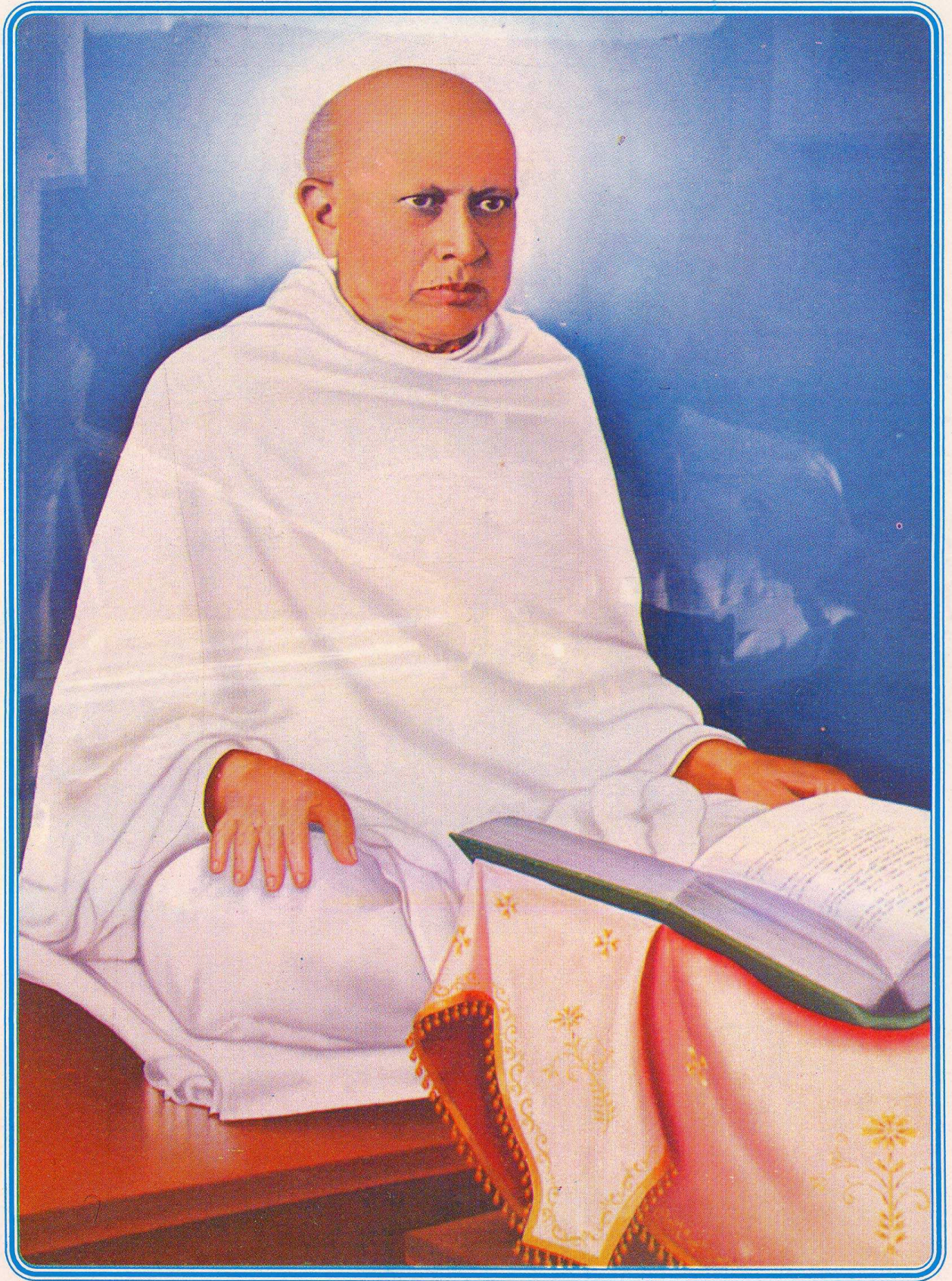
● परमोपकारी पूज्य गुरुदेव श्री कानशु स्वामी ●