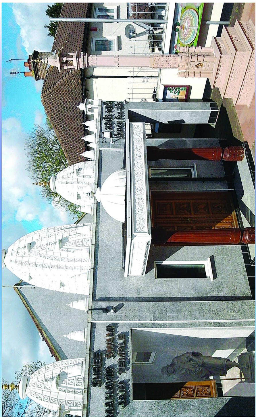
લંડનનું જિન મંદિર